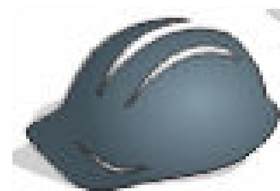
CAPACETE COM JUGULAR